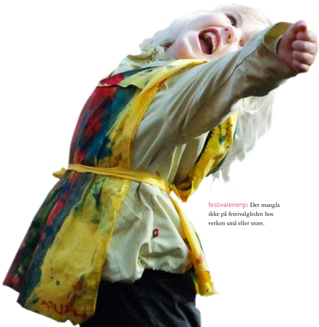
festalenergi: Det mangla ikke på festivalgleden hos verken små eller store.