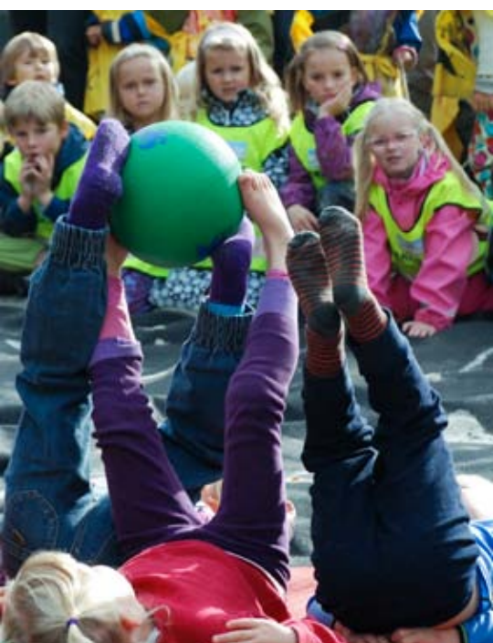
ballkunstnere: Små føtter - stor ball.