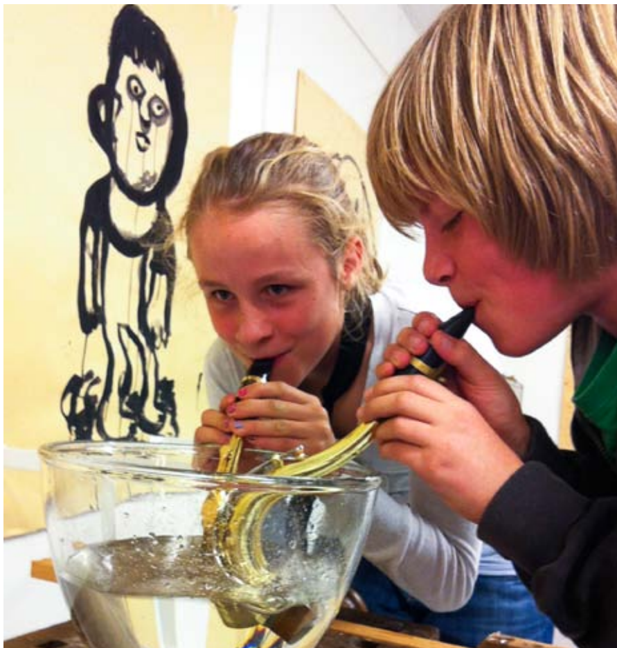
fiskenes sang: Saxofonelever ved Kongsberg kulturskole er engasjert i KRUt-Xperimentet.

På norsk side deltar ni kulturskoler fra fem fylker: Horten, Larvik, Nøtterøy (alle Vestfold), Drammen, Kongsberg (begge Buskerud), Kristiansand, Mandal (begge Vest-Agder), Moss (Østfold), Skien (Telemark).