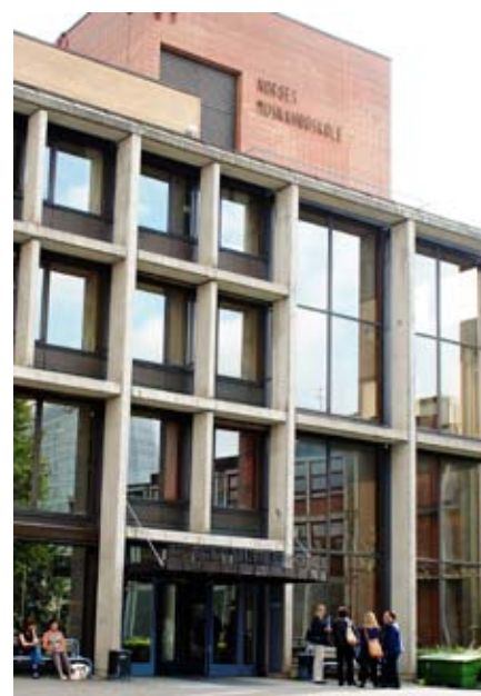
nytt studium: Et erfaringsbasert mastergradsstudium i kulturledelse er under planlegging ved Norges musikkhøgskole.