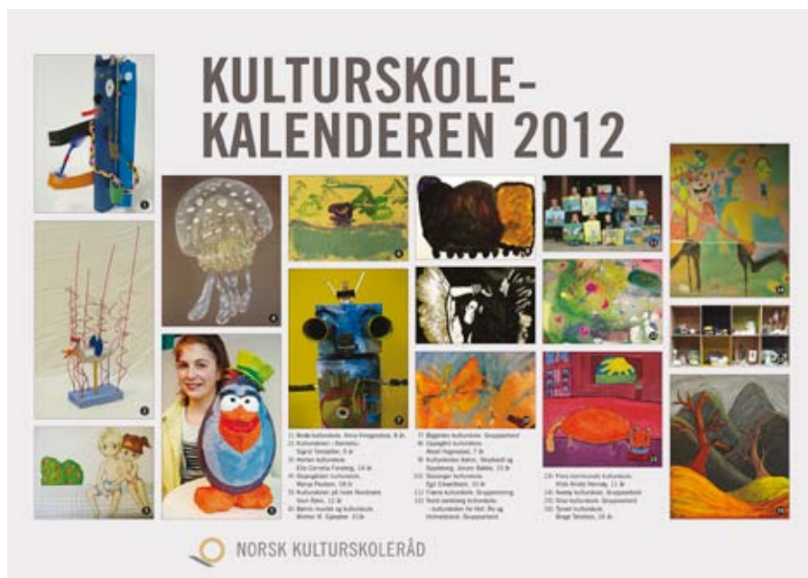
kalenderkunst: Omslaget til Kulturskolekalenderen 2012.

– Jeg ønsker å takke alle som bidro med flotte arbeider av høy kvalitet for innsatsen. Takk også til de mange som leverte gode forslag, men som det dessverre ikke ble plass til denne gangen. Håper