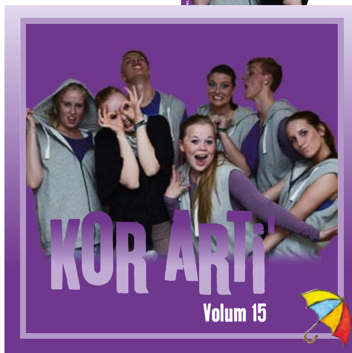
pop cd: Kor Arti' volum 15 vekker minst like stor begeistring som sine 14. forgjengere hos sangglade pedagoger.

Kor Arti' Digital er blitt presentert grundig i mange fora i høst, selvsagt også på de 18 Kor Arti'-kursene som er holdt av