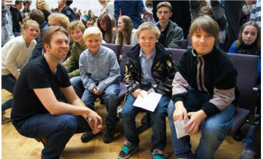
inspirerende møte: Å møte Leif Ove Andsnes var inspirerende og lærerikt for kulturskoleelevene på første rad.

Kammerorkesterets tilbud er blitt svært populært: Nærmere 300 elever og lærere samt noen foreldre fra kulturskolene i Asker, Frogn, Moss, Oslo, Bærum, Oppegård, Nes, Horten og Vestby fikk blant annet høre om Andsnes første konsert i Aulaen som niåring, og de fikk spørre ham om alt fra alvorlige spørsmål som «hvor mye øvde du som barn» til de mer muntre som «er du romantisk?».