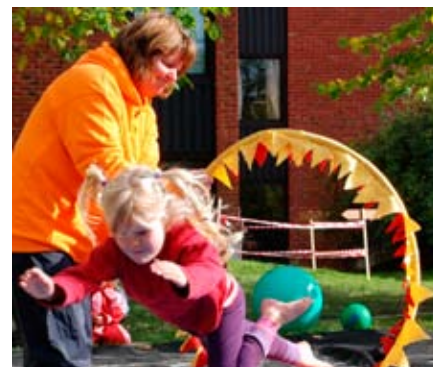
flyvende akrobat: Ung sirkusartist i luften.