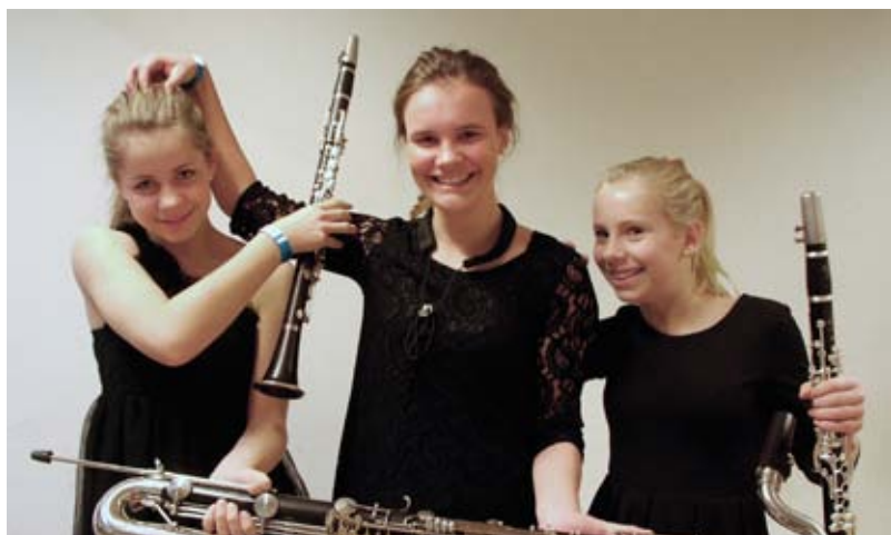
trioablegøyer: Ullevål klarinettrio shower gjerne litt rett før de skal på scenen.