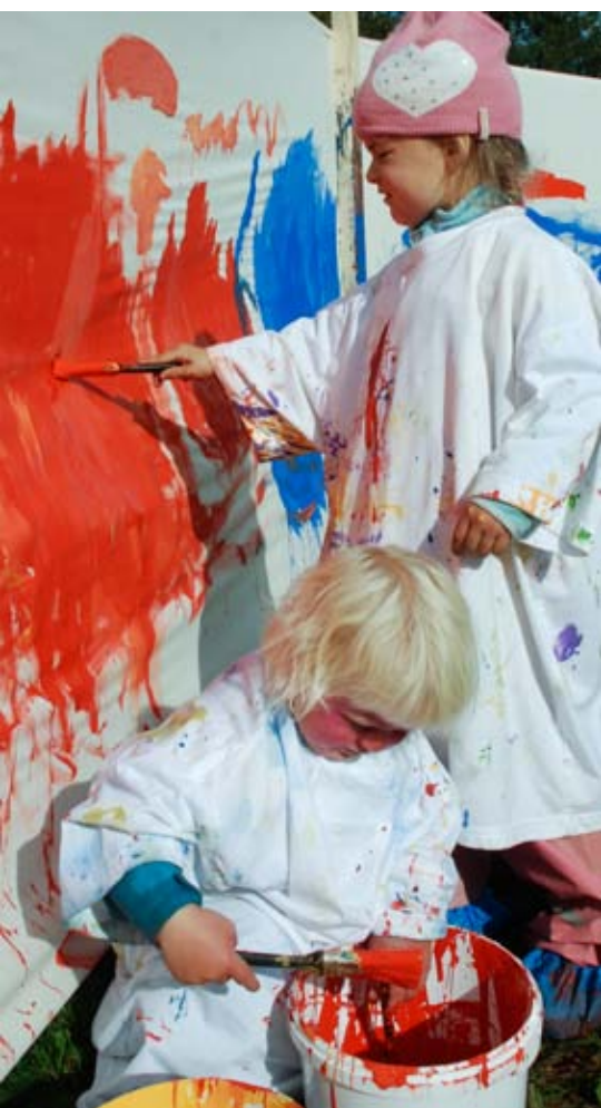
rødt skal det være: Festivalen hadde eget utendørsatelier.