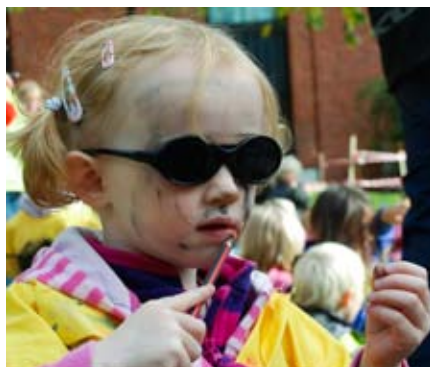
selvutsmykking: Det går jo fint å male seg sjøl også.